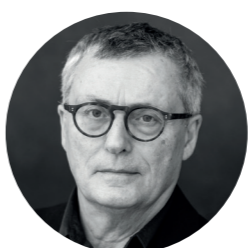
Maurizio Balò scene e costumi

Federico Vigorito, attualmente impegnato come attore e regista per produzioni nazionali, si dedica allo studio della letteratura contemporanea con particolare attenzione alle nuove drammaturgie. Al suo attivo circa 40 spettacoli, tra i quali ricordiamo "Il Vantone" di P.P. Pasolini alla 58ma edizione del Festival dei due Mondi di Spoleto, "Golden He" di C. Piraino vincitore del Festival Ermo Colle 2016, "La Ridicola Notte di P." di M. Bernardi per il Napoli Teatro Festival 2018, "Antigone" di Sofocle.